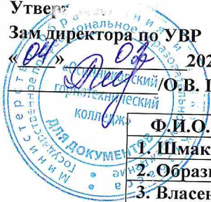
График дежурства в общежитии ГПОУ ОГТК классных руководителей горного и промышленного отделений ФЕВРАЛЬ 2020-2021 учебный год